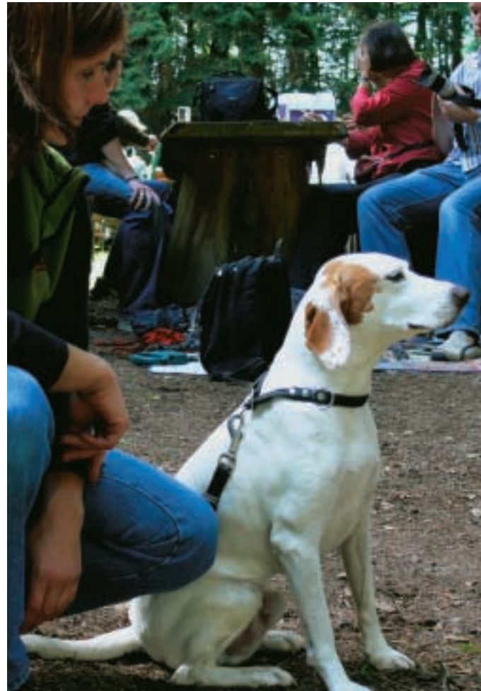
Ein echter, wenn auch exotischer Jagdhund: die Istrische Kurzhaarbracke Bela.

zeigt keine Charakterschwächen, kann er an geeignete Halter vermittelt werden. Die Internetseite des Vereins (siehe Infokasten) bietet dafür eine gute Plattform. Dort findet man unter anderem die Beschreibung von Hunden, die im Rahmen der Vermittlungshilfe momentan angeboten