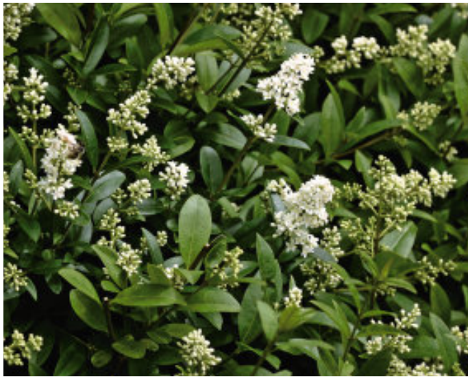
Liguster ( Ligustrum vulgare ).