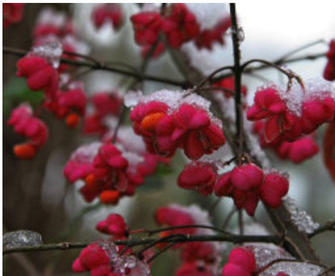
Pfaffenhütchen ( Euonymus europaeus ).