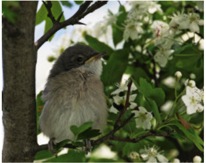
Flügel Klappergrasmücke im Weißdorn ( Crataegus monogyna ).