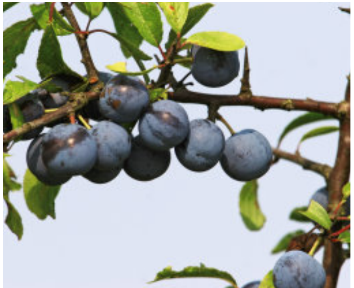
Schlehe/Schwarzdorn ( Prunus spinosa ).