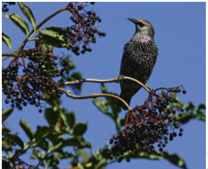
Star auf Schwarzem Holunder ( Sambucus nigra ).