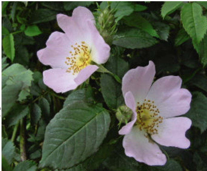
Hundsrose ( Rosa canina ).