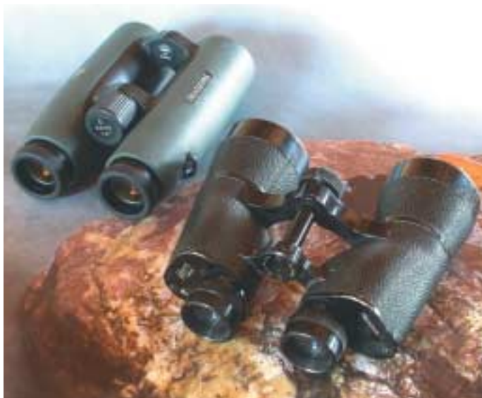
Alt und Neu: Ein Kern-Porroprismenglas (Schweizer Armeefeldstecher) im Vergleich mit dem schlanken Dachkantprismenglas Swarovski EL.

Einzig die Ferngläser von Zeiss verfügen über die optisch aufwendigen Abbe-König-Prismen. Bei diesen Prismen treten wegen der Totalreflexion keine Lichtverluste auf. Allerdings verlangt die Herstellung sehr große Präzision. Bei diesem Prismensystem wird jedoch die Baulänge konstruktionsbedingt etwas größer und das Fernglas geringfügig länger.