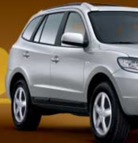
Santa Fe. Der Sportsroader.

Wie weit Ihre Reise auch gehen soll, sie wird ab jetzt immer erst dann enden, wenn Sie es wollen. Denn selbst tiefes Gelände, brenzlige Steigungen und Watttiefen von bis zu 50 cm meistern Sie im Terracan problemlos. Und während