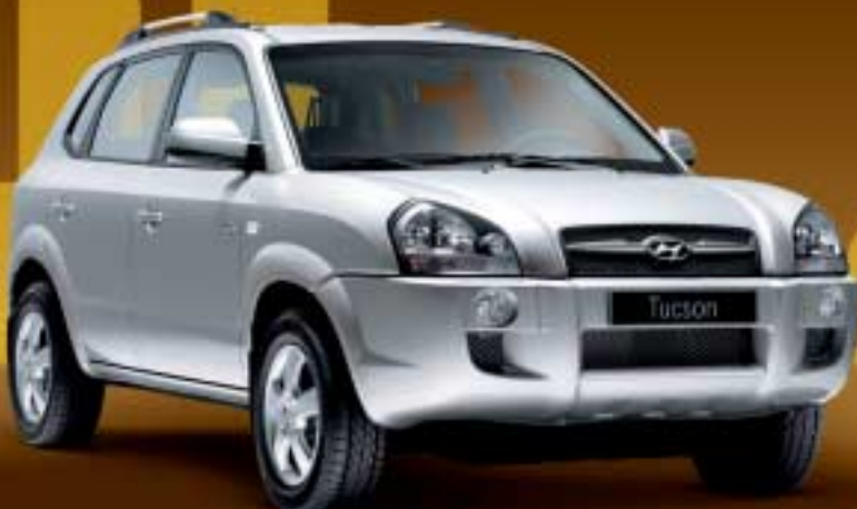
Tucson. Der Cityroader. Ab 18.990 EUR*