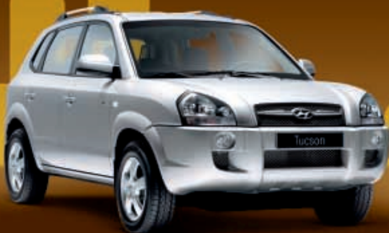
Tucson. Der Cityroader. Ab 19.390 EUR*