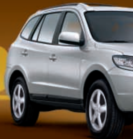
Santa Fe. Der Sportsroader.

Wie weit Ihre Reise auch gehen soll, sie wird ab jetzt immer erst dann enden, wenn Sie es wollen. Denn selbst tiefes Gelände, brenzlige Steigungen und Wattiefen von bis zu 50 cm meistern Sie im Terracan problemlos. Und während