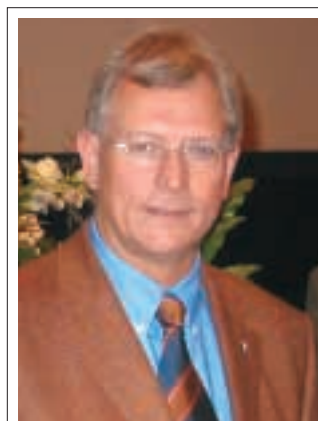
Eckhard Uhlenberg (CDU) ist Minister für Umwelt und Naturschutz, Landwirtschaft und Verbraucherschutz des Landes Nordrhein-Westfalen. Er wurde am 16. Februar 1948 in Werl geboren, ist verheiratet und hat drei Kinder. Nach einer Landwirtschaftslehre wurde er Landwirtschaftsmeister, selbständiger Landwirt und Jäger.