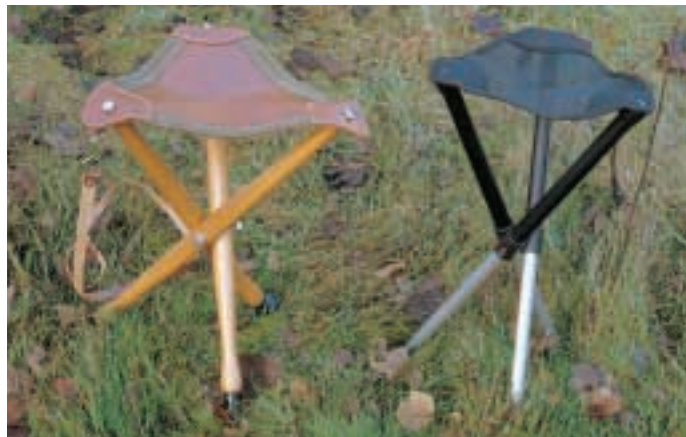
Die beiden Dreibeine im Testfeld.

Auch die dreibeinigen Konstruktionen haben eine dreieckige Sitzfläche, entweder aus Leder oder einem Kunststoffmaterial und lassen sich zusammenklappen. Sie können aber nicht als Gehhilfe benutzt werden und müssen zum Transport entweder am Rucksack befestigt oder aber unter dem Arm getragen werden. Manche Modelle haben auch einen Umhängeriemens zum leichteren Transport. Der Sitzkomfort ist vergleichbar mit dem eines guten Einbeinstuhles wie dem AKAH Drehsitzstock, aber durch