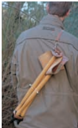
Das Dreibein von Frankonia ist sehr sauber verarbeitet und bietet eine zünftige Optik. Die Sitzhöhe ist aber auch hier viel zu niedrig.

Das klassische Dreibein aus Holz und Leder: große Sitzfläche mit verstärktem Rand aus Rindleder und Stahlspitzen an den Enden der drei Beine. Die Sitzhöhe beträgt 45 Zentimeter, und der Stuhl bringt 1,7 Kilogramm auf die Waage. Die Sitzfläche ist zwar schön groß, die Höhe aber viel zu gering. Ein Lederriemen erlaubt das Umhängen des Sitzstuhles zum leichteren Transport. Er kostet 69,95 Euro.