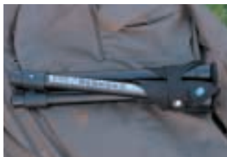
Der Walkstool hat ausgezogen immerhin 55 Zentimeter Sitzhöhe.

„Walkstool“ nennt der schwedische Hersteller den federleichten, dreibeinigen Sitzstuhl, der sich auf Taschenformat zusammenschieben lässt. Er ist so kompakt und mit einem Gewicht von knapp 650 Gramm so leicht, dass er problemlos mitgeführt werden kann. Zusammengeschoben passt die hier benutzte 55-Zentimeter-Version mit einer Transportlänge von zusammengescho-