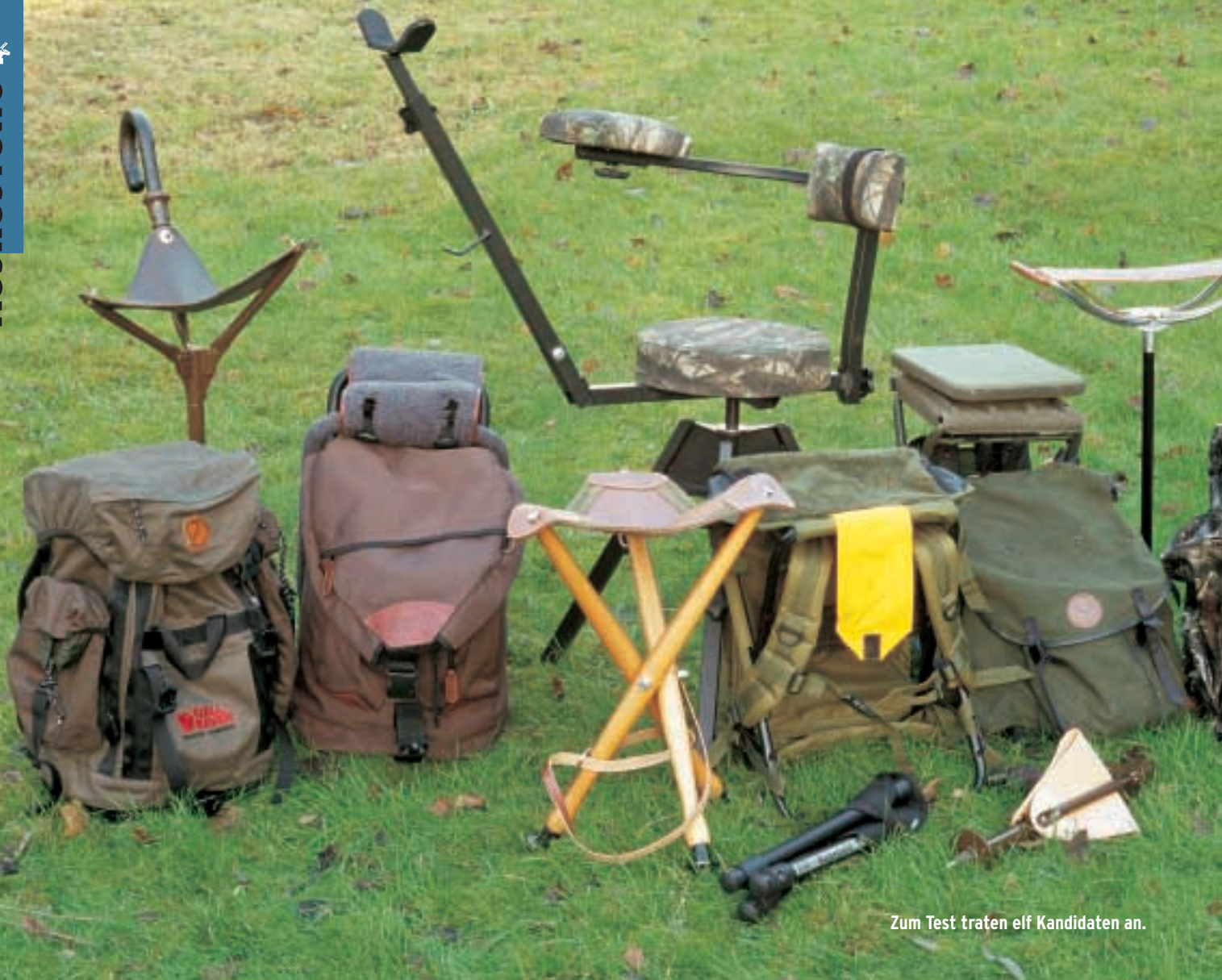
Zum Test traten elf Kandidaten an.