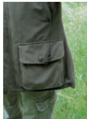
Die Laksen Stirling: hier in der Damenversion Paisley. Pfliffiges Detail ist ein Karabinerhaken in der rechten Außentasche, an dem sich ein Klappmesser oder die Hundepfeife befestigen lässt.

Praxis als wesentlich leiser als etwa der Klassiker GoreTex.