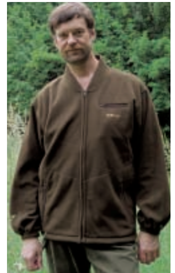
Die Härkila Discovery ist wohl die bestausgestattete Jacke im Test und lässt sich fast das ganze Jahr über tragen. Leider ist sie für den Ansitz zu laut. Die eingeknöpfte Fleecejacke ist sehr warm und auch einzeln nutzbar.

für den Ansitz, doch der Gore-Tex-Liner raschelt sehr laut, das ist der einzige Nachteil dieser sehr aufwendigen Jacke. Die Discovery kostet 429 Euro, die Fleeceinnenjacke zusätzlich 98 Euro.