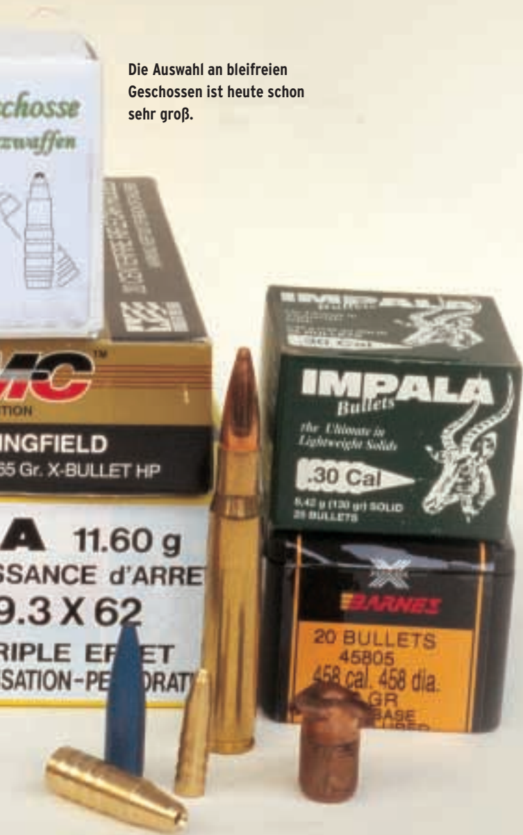
Die Auswahl an bleifreien Geschossen ist heute schon sehr groß.