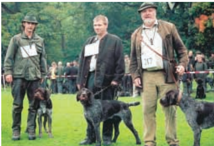
Die drei bestplatzierten Hunde (von rechts): „Cliff von der Rassobrücke“: 243 Hegewaldpunkte, „Zack vom Spanger-Forst“: 242 Hegewaldpunkte, „Cisko von der Aitrachau“: 239,5 Hegewaldpunkte.