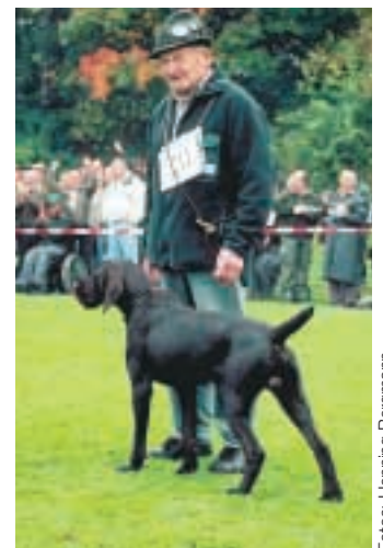
Der schönste Rüde „Kauz vom Eichenloh“.

Für den Deutsch-Drahthaar ist die Arbeit auf der Spur ein traditionsreicher Eckpunkt auf dem züchterischen Weg zum „Hund der Folge“, zum Verlorenbringer, zum Hund nach dem Schuss, der