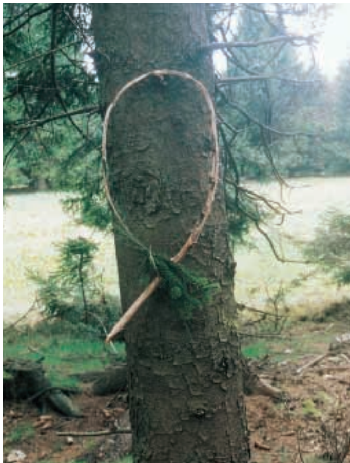
Zwei der klassischen Bruchzeichen, die wir alle in unserer Jungjägerausbildung gelernt haben: (links) Warnbruch, (rechts) Standplatzbruch, Folge nach rechts. Haben Sie diese Bruchzeichen jemals im praktischen Jagdbetrieb eingesetzt?

sellschaftsjagden nicht mehr überall in Deutschland praktiziert werden. Bei Gesellschaftsjagden auf Schalenwild sind die bejagten Flächen oft so groß, dass man mit Plesshörnern allein nicht mehr zurecht kommt und man entweder nach der Uhr jagt oder elektronische Geräte einsetzt.