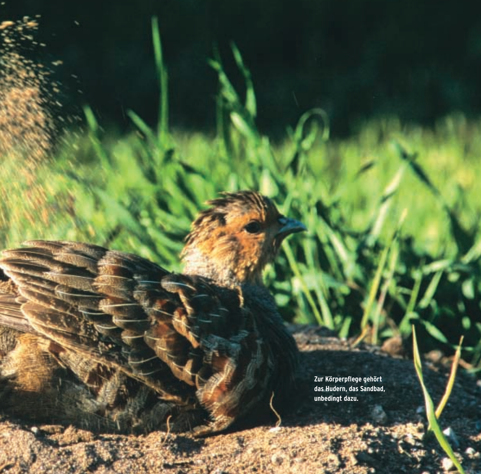
Zur Körperpflege gehört das Hudern, das Sandbad, unbedingt dazu.