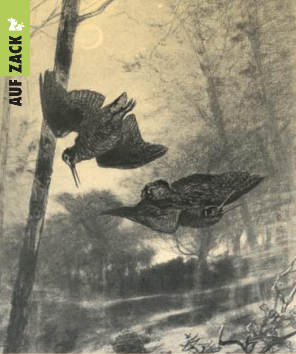
Stechende Schnepfen: Eine der vielen Abbildungen aus einem Prachtband aus Diezels „Niederjagd“. Die Erstausgabe erschien 1849.

dem Adel, sprich den Landesfürsten, verliehen.